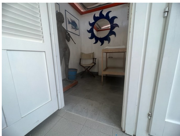
Accesso locale spogliatoio