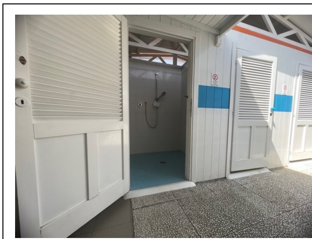
Accesso locale doccia