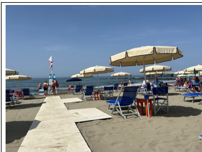
Postazioni ombrelloni con pedane